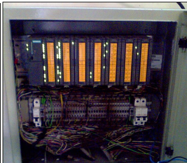
2. PLC Simatic S 7 -300 yang baru