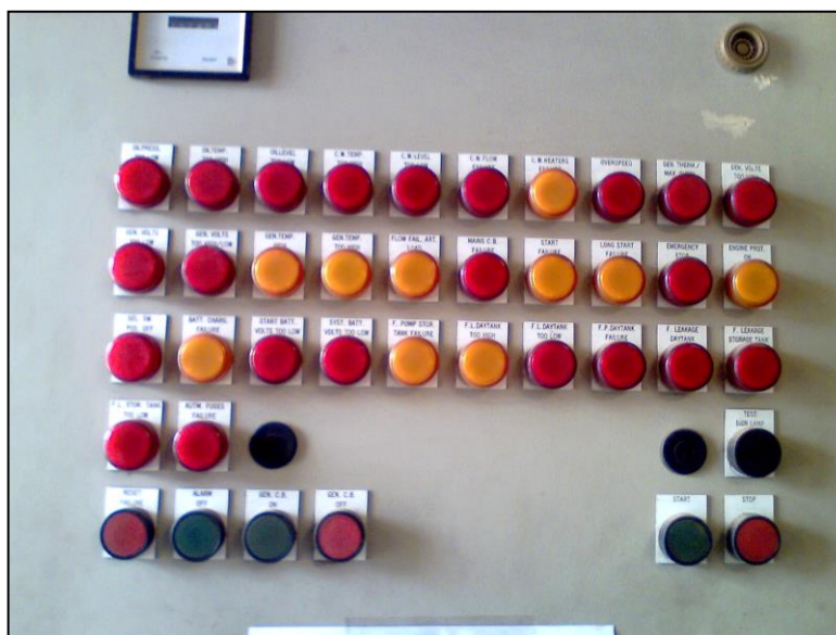
Gambar 3. Tombol start pada panel BRV 20