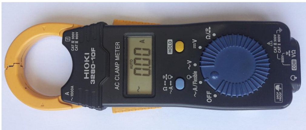
Gambar 2. Ampere meter digital

Tang ampere meter digital atau digital clamp meter adalah sebuah alat ukur yang sangat nyaman digunakan yang memberikan kemudahan pengukuran arus listrik tanpa mengganggu rangkaian listriknya hanya dengan meng- clamp kan pada salah satu kabel fasa listrik. Salah satu keuntungan dari metode ini adalah kita dapat mengukur arus tinggi tanpa harus mematikan terlebih dulu rangkaian yang akan diukur. Cara menggunakan Tang ampere digital adalah sebagai berikut: