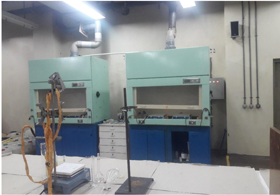
Gambar 3. Lemari asam ( fume hood ) yang berada di HR 24 IEBE

Lemari asam adalah tempat untuk melakukan preparasi sampel yang berkaitan dengan kegiatan penelitian utamanya bahan bakar nuklir. Material yang digunakan untuk preparasi umumnya mengandung bahan mudah menguap, berbahaya dan beracun.