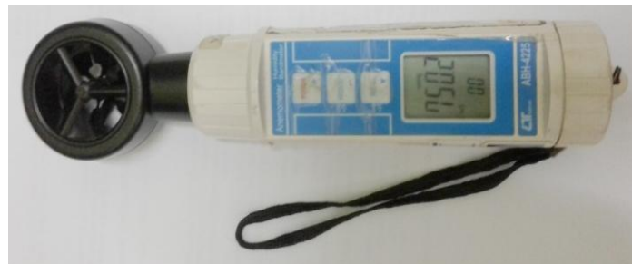
Gambar 4. Anemometer digital

Lemari asam adalah tempat untuk melakukan preparasi sampel yang berkaitan dengan kegiatan penelitian utamanya bahan bakar nuklir. Material yang digunakan untuk preparasi umumnya mengandung bahan mudah menguap, berbahaya dan beracun.