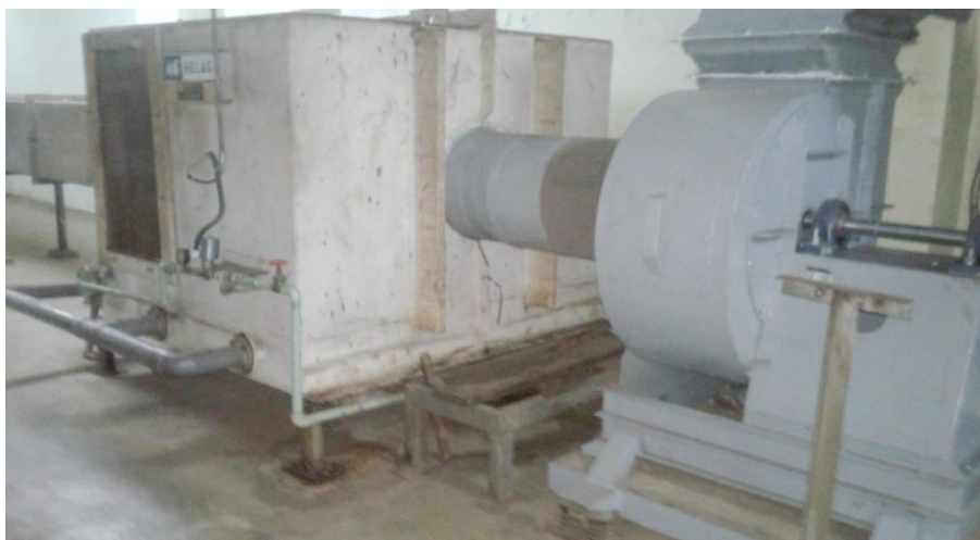
Gambar 1. Sistem Scrubber di HR 51 IEBE [3]

Pemantauan lemari asam ( fume hood ) di HR 24 di Instalasi Elemen Bakar Eksperimental dilakukan dengan cara mengatur arus motor sistem scrubber (Gambar 1) saat beroperasi diukur menggunakan ampermeter merk HIOKI 3280-10F dan mengatur kecepatan alir udara di lemari asam ( fume hood ) A dan B ruang HR 24 diukur menggunakan anemometer merk Lutron ABH-4225. Posisi pengukuran pada lubang hisap yang berada di sisi dalam bagian belakang lemari asam ( fume hood ) atau pada pintu dengan celah dibuka setinggi 6 cm. Pengukuran dilakukan mulai 2 Januari sampai 31 Desember 2018 secara berkala dan atau adanya permintaan maupun saat diperlukan.